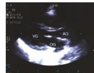
Échographie du cœur

Insuffisance cardiaque « diastolique » : le cœur a du mal à bien se relaxer, donc il se remplit moins bien.