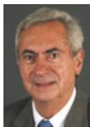
Pr Jacques Beaune, cardiologue.

Le stress aigu provoque une augmentation des besoins de sang au niveau du cœur, alors qu'il y a dans le même temps une diminution des apports et un risque de formation de caillots... Ces phénomènes provoquent un défaut de perfusion cardiaque, qui peut conduire à l'infarctus et à l'arrêt cardiaque (mort subite). »