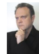
Cyril Tarquinio, psychologue, professeur à l'université de Metz. www.cyriltarquinio.com

Des professionnels de la psychologie proposent des méthodes efficaces pour réduire les effets du stress et de l'anxiété. Cette approche est complémentaire des méthodes de prévention physique classiques et reconnues. »