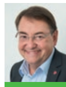
Pr Alain Furber

Dire non au tabac, avoir une alimentation équilibrée et faire de l'exercice tous les jours : c'est ainsi qu'il est possible de vivre mieux plus longtemps.