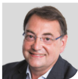
Pr Alain Furber

Nous sommes tous concernés et tout le monde peut agir !